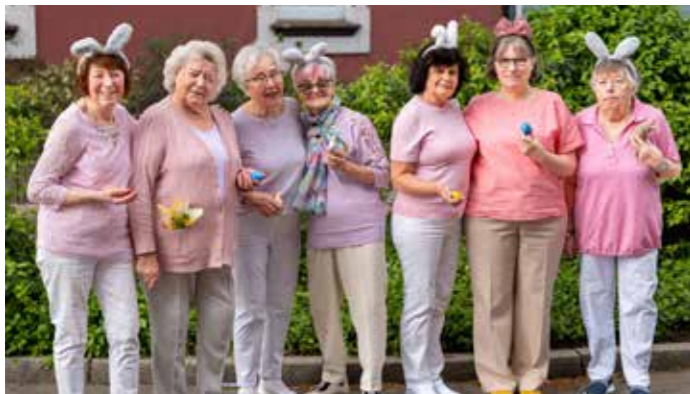
Die Organisator*innen in Stoppenberg kamen wie aus dem Ei gepellt.

Allen ehrenamtlichen Helfer*innen, die diese Feiern möglich gemacht haben, gilt unser herzlicher Dank!