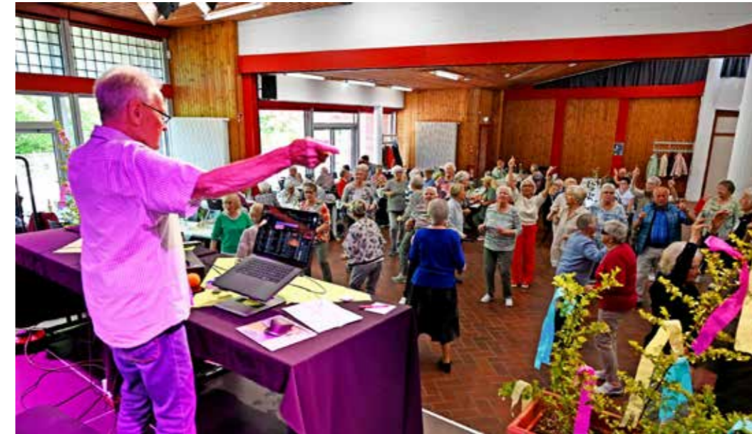
Der AWO Ortsverein Essen Ost ist quicklebendig. Hier wurde auch so richtig in den Mai gefeiert.