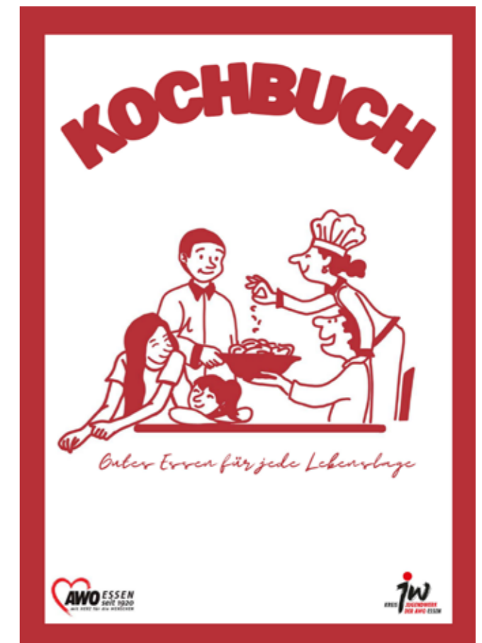
Grafik: Kreisjugendwerk AWO Essen

Nun ja, ganz klein kann man die Anleitung eher nicht nennen, die das Kreisjugendwerk da zusammengestellt hat. In insgesamt sechs Ka-