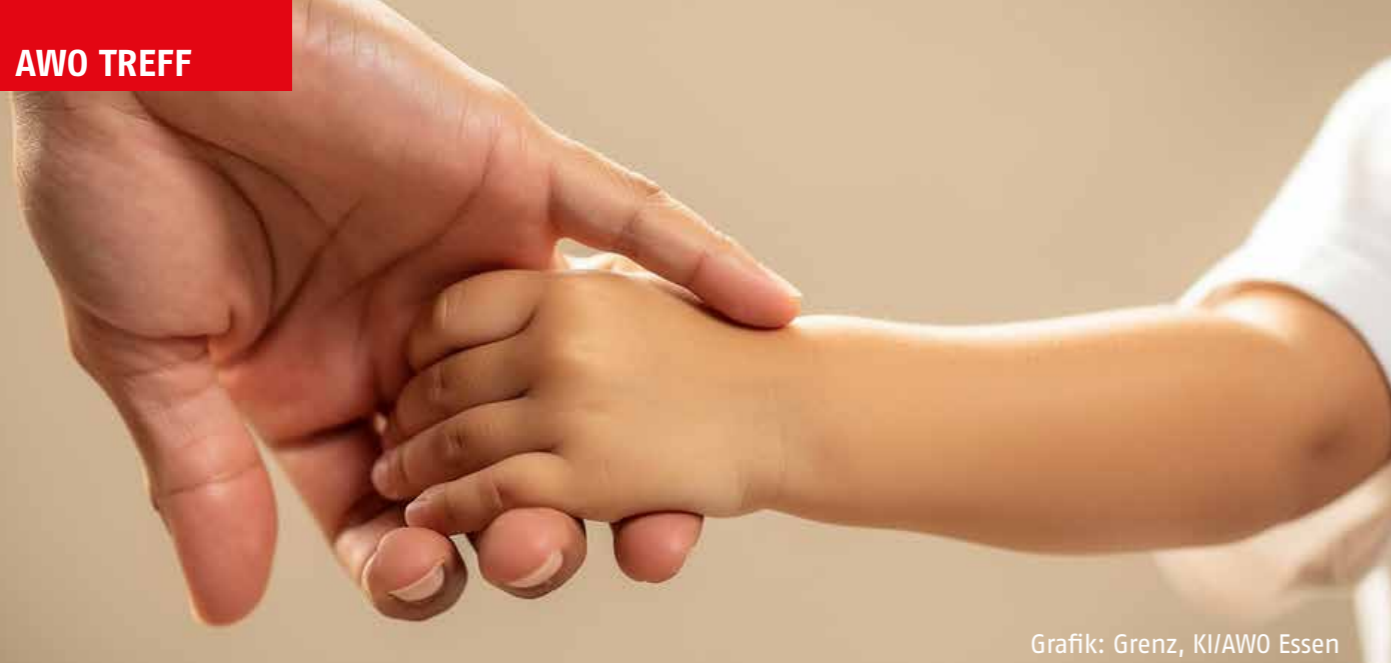
Grafik: Grenz, KI/AWO Essen