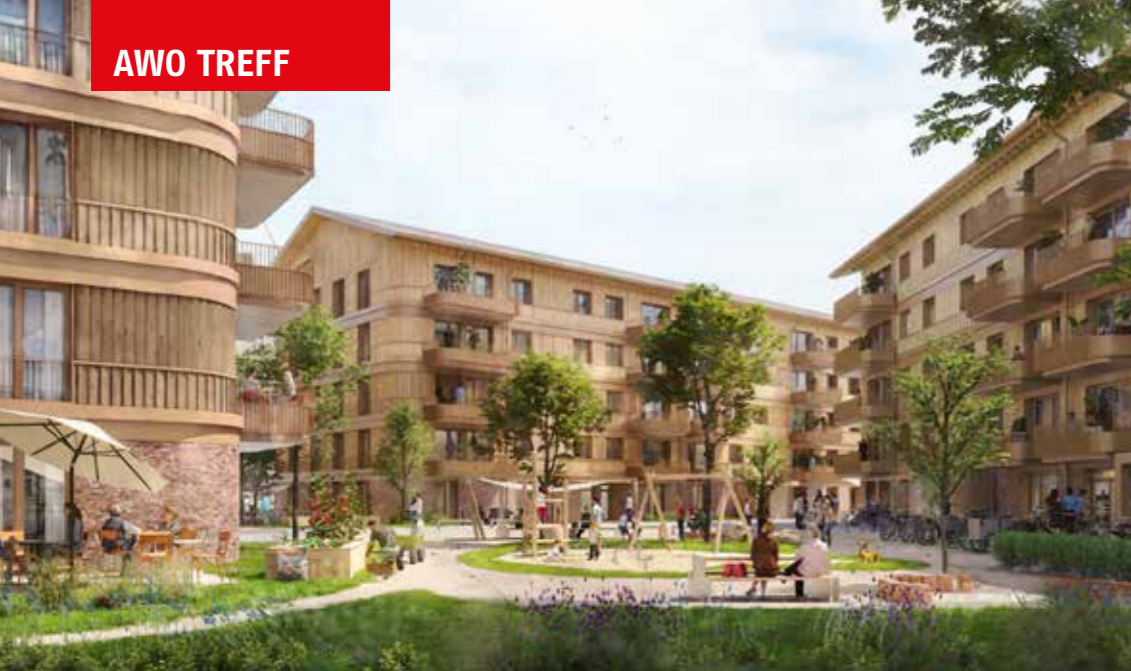
Der grüne Innenhof des Bauprojektes „Deilegrund“ in Kupferdreh wird das Miteinander im Quartier fördern. Grafik: Sustina AG