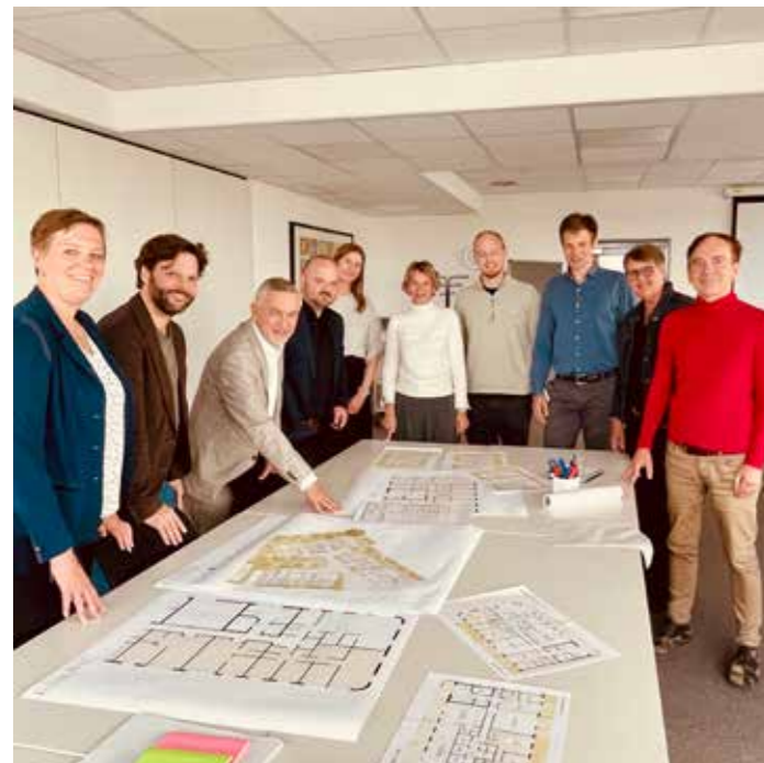
Bei der Planung des Quartierskonzeptes „saß“ die AWO mit am Tisch.

Ein grüner Innenhof mit Spielplätzen, Gemeinschaftsgarten sowie diversen Aufenthalts- und Gemeinschaftsflächen wird das Miteinander fördern. Das werden sicher auch ein Quartierscafé mit Terras-