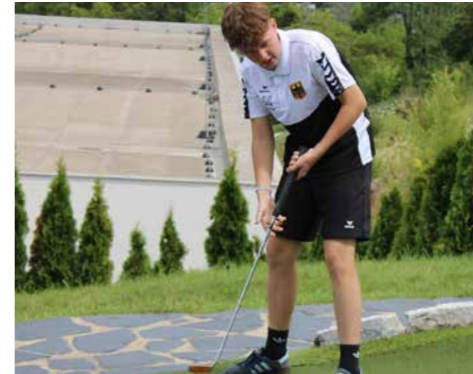
Konzentration ist im Turnier ein A und 0 – erst recht im Nationaltrikot.

Ich spiele bei 18 Bahnen meistens mit um die 15 Bällen – es gibt die in drei Größen und ganz unterschiedlich in Sprunghöhe, Härte und Gewicht.“